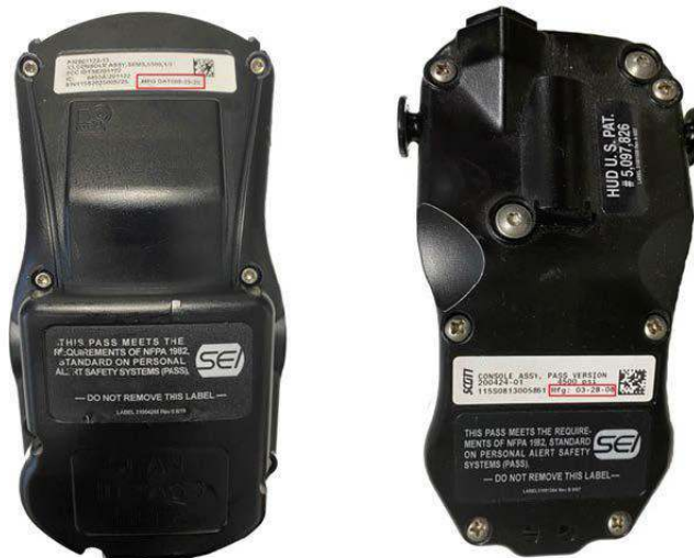
F : Figure 2

Veuillez consulter la Figure 2 ci-dessous pour des exemples d'étiquetage pour vous aider à déterminer la date de fabrication de votre console d'appareil de protection respiratoire isolant autonome qui vous aidera à déterminer si votre appareil de protection respiratoire isolant autonome est susceptible d'être compromis et nécessite une inspection ultérieure.