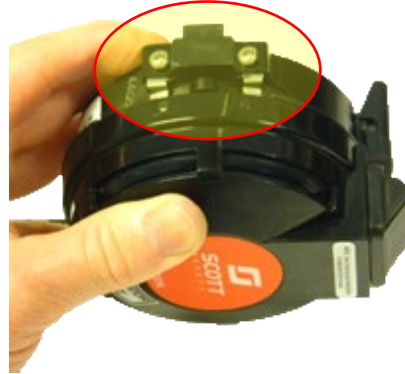
Vis de couvercle en place